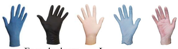
Face de dessous = Les normes